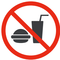
Nourriture et boissons Food and drinks