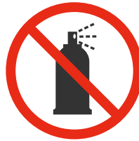
Aérosols Aerosol spray cans