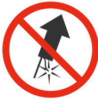
Objets pyrotechniques Pyrotechnic objects